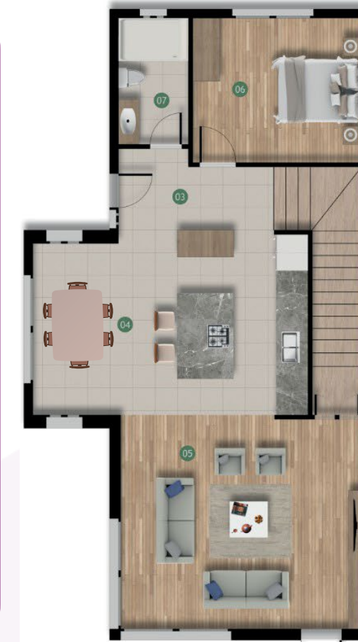
Zemin Kat Planı