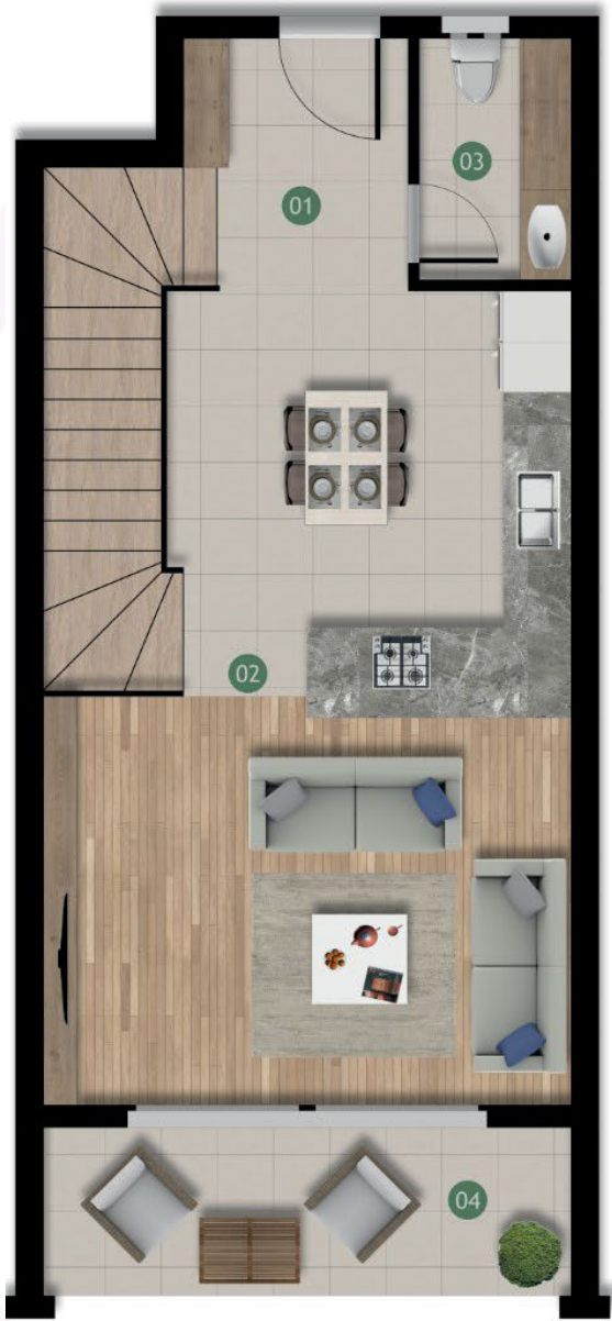
Zemin Kat Planı