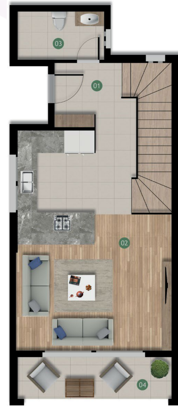
Zemin Kat Planı