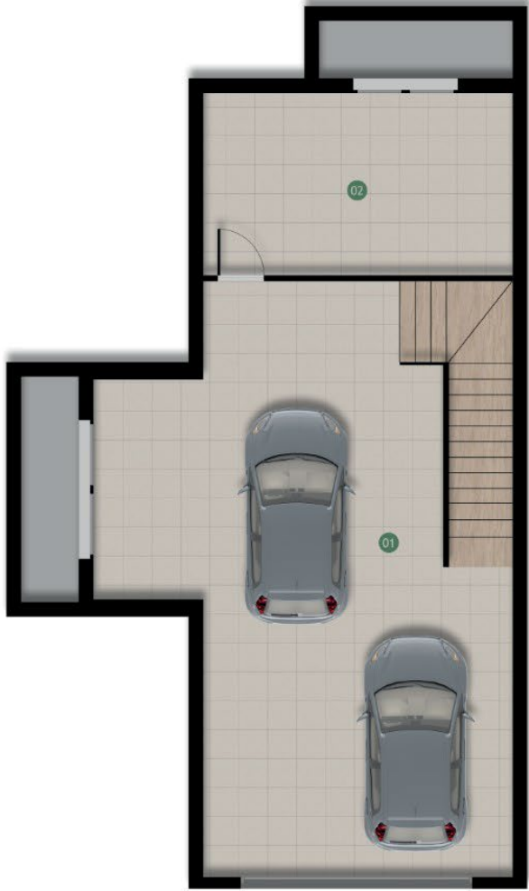
Bodrum Kat Planı