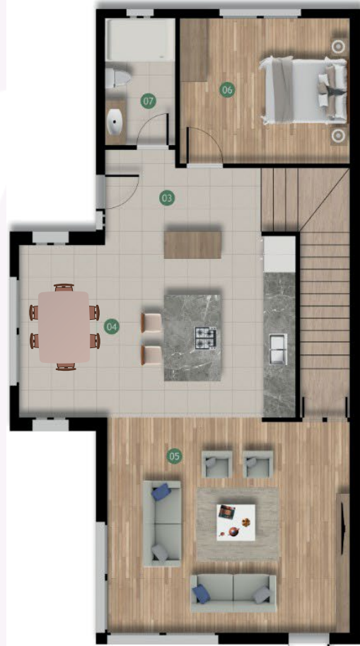
Zemin Kat Planı